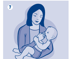
Adults & Children / Erwachsene & Kinder / Erişkinler & Çocuklar