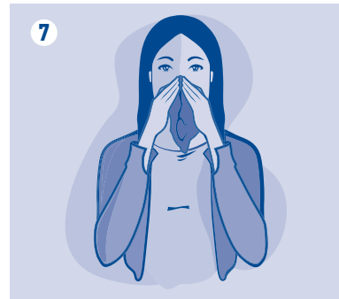
Sinomarin® Cold & Flu Relief 30 ml